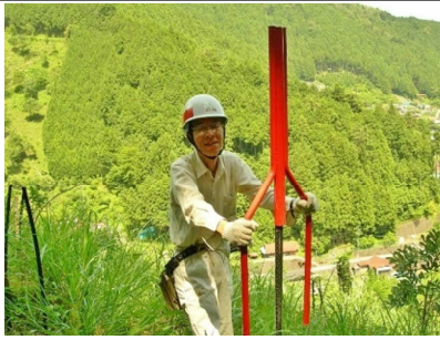
鹿ネット用のくい打ち

■活動初期の、ご苦労されたことを聞かせていただけますか？それらを、どのように乗り越えられましたか？