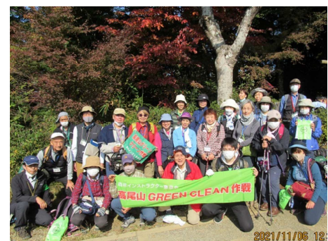
2021(令和3)年11月6日 第126回、日影沢～いろはの森コース