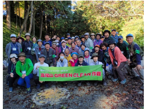
2023(令和5)年11月4日 第150回、小仏～城山コース

自分が総括幹事を引き継いだ後、途中から、安全のために班分けし、自然観察を重視するようになりました。引率するFIT班長の上から目線になりがちなので、一般ボランティア参加者の対等な仲間意識が希薄にならないか気がかかりますね。