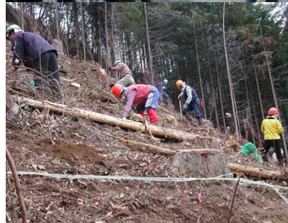
2003(平成15)年3月29日 第1回植樹祭 80名もの森林ボランティアが集まり、完全伐採の森に広葉樹と針葉樹を植樹