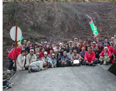
2004(平成12)年3月28日 第2回植樹祭