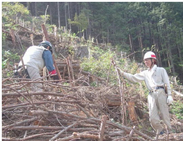
地拵えの残材整理中

※編集部注4: 参考URL) 活動報告 http://www.forest-tokyo.org/forest/hatonosu/katudo.htm