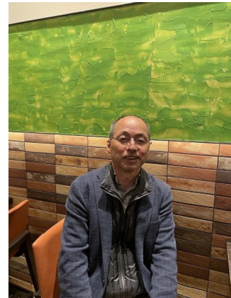
2023(令和5)年11月29日 小笠原についてのお話は時間切れで伺えず、次回に持ち越し

(宮入)もう一つ、雪の日に開催した親子観察会もありました。数年前に火事でなくなってしまったんですが、日影沢キャンプ場に二階建ての管理棟「ウッディハウス」(※編集部注1)があって、雨の日でも木の種を飛ばす遊びや紙芝居など屋内でのプログラムができたので、「中止」ということはなかったんですね。来れる方は、来てください、というスタンスで、ある時、ものすごい大雪の日に2組の親子がいらっしやって、やっと歩いて行って大変でした。コガラとアトリの混群が飛んでいて、子供たちは喜んでいましたけどね。